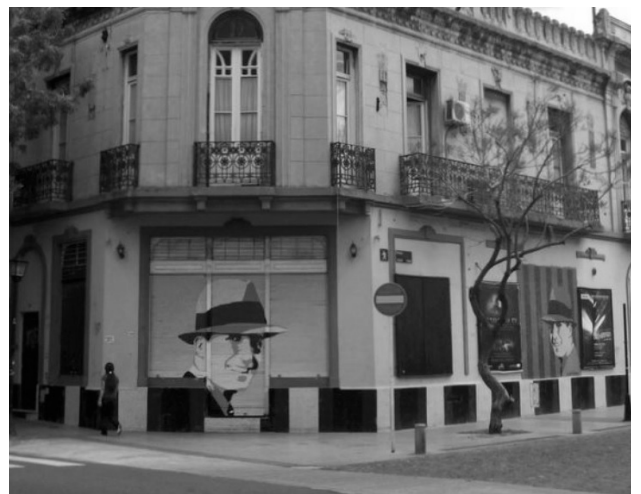
torno” del Área de Protección Histórica N° 32 Mercado de Abasto.

Con respecto a la Ley de catalogación, la lista completa de inmuebles individuales con protección cautelar (resguardo de fachadas y exteriores) se puede consultar como el Anexo 5 de la Ley de Aprobación Inicial N° 2693/LCABA/24 publicada en el Boletín Oficial porteño del 18 de octubre. Son unas 550 propiedades, que se agregan a las ya protegidas por otras normativas. Además, en el Anexo 2 hay incorporados unos 30 inmuebles “en el en-